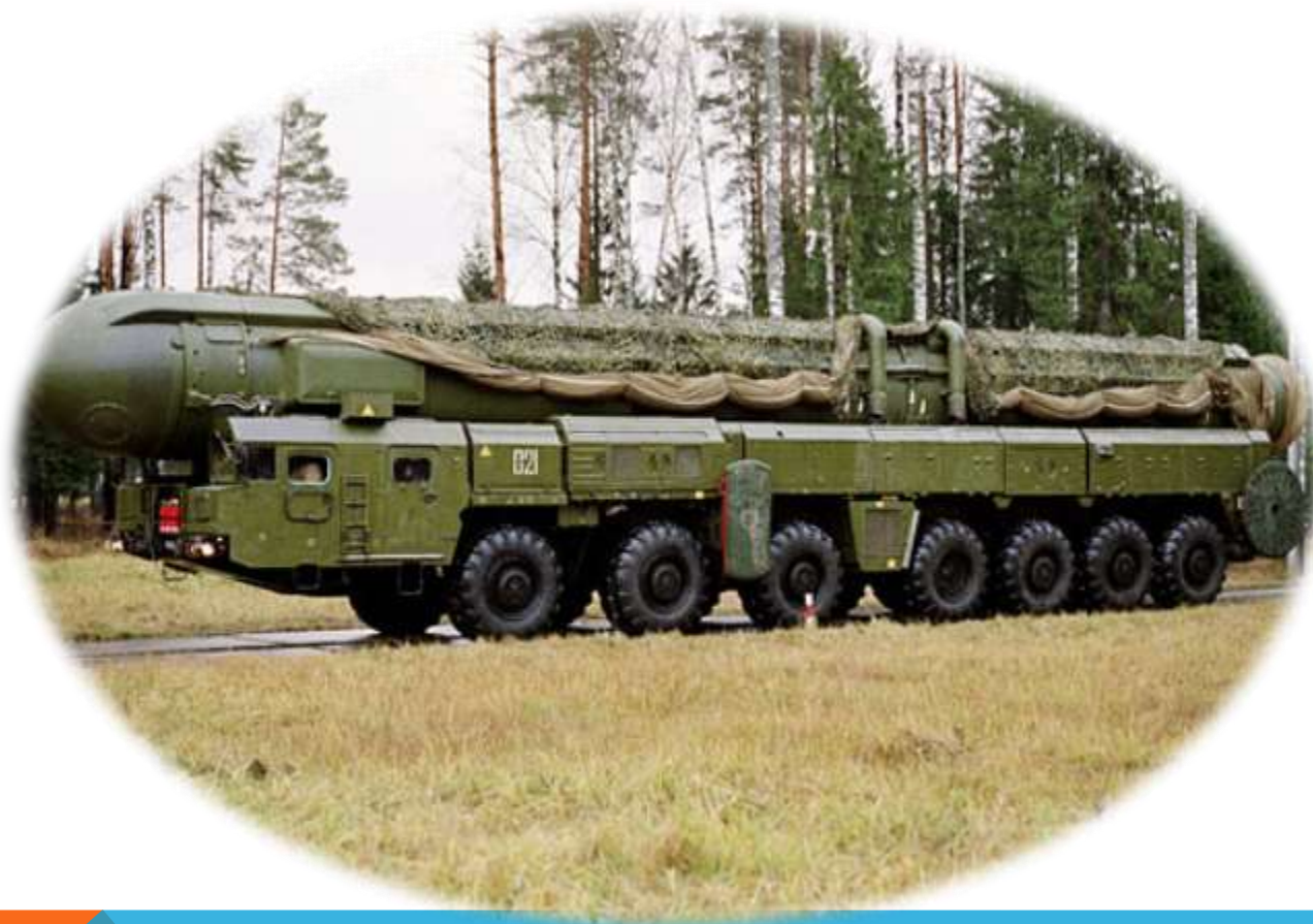
Машина боевого управления