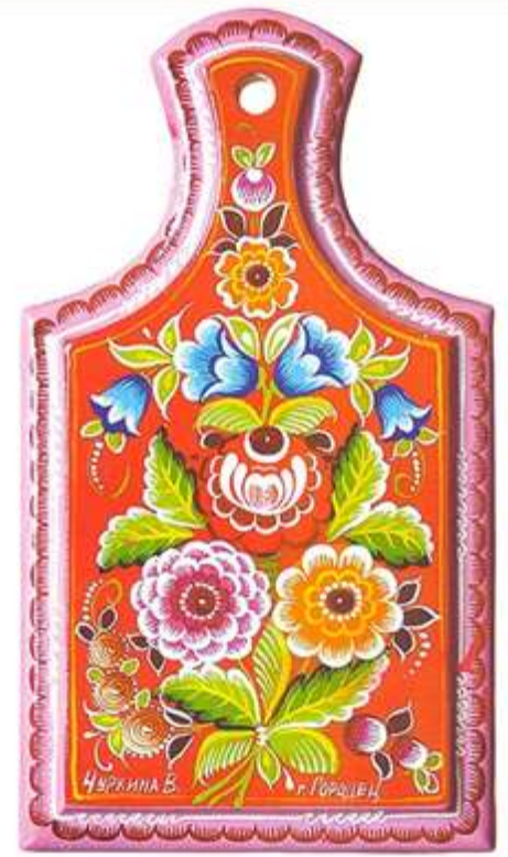
ДОСКА - ГОРОДЕЦКИЕ ЦВЕТЫ